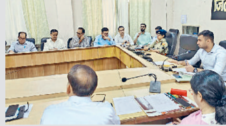
जीद। बैठक में खरीद कार्य को लेकर दिशा-निर्देश देते एडीसी।

धान खरीद कार्य को समय पर जारी हिदायतों के अनुसार किया जाए मंडियों में किसी भी तरीके से न लगने पाए जाम अतिरिक्त उपायुक्त ने कहा कि सभी विभाग आपसी तालमेल व समन्वय से कार्य करें। मंडियों में आने वाले वाहनों से जाम की स्थिति न बने इसके लिए विशेष व्यवस्था की जाए। सड़कों की सफाई पर मरम्मत हो और मंडियों से किसी प्रकार का नकारात्मक सूचना प्राप्त न हो। एडीसी ने निर्देश दिए कि धान खरीद कार्य को सरकार द्वारा समय-समय पर जारी हिदायतों के अनुसार किया जाए। किसी प्रकार की फर्जी खरीद न हो तथा सभी रिकर्ड पूर्ण रूप से समय पर तैयार किए जाएं। उन्होंने पुलिस विभाग को निर्देश दिए कि मंडियों में सूचारु परिवहन व्यवस्था व सुरक्षा हेतु पर्याप्त पुलिसबल को तैनाती की जाए। सभी उपमंडल अधिकारी अपने-अपने क्षेत्रों की मंडियों में खरीद कार्य की निगरानी सुनिश्चित करेंगे।