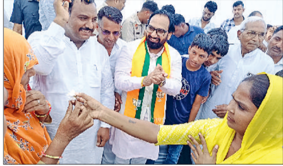
उचाना। सफाई कर्मचारियों के कंकटाने के बाद एक-दूसरे का मुंह मिटा करवाते हुए।