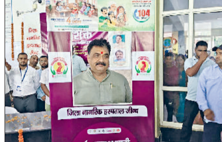
पैशन प्रमाण पत्र बांटे