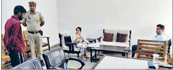
जीद। मामले की सुनवाई करते हुए सीजेएम।

सीजेएम ने कारागार में बंदियों से बातचीत कर मुफ्त कानूनी सेवाओं के बारे में अवगत कराया