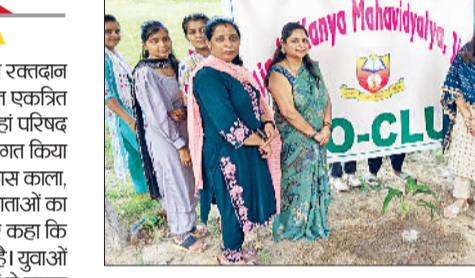
जीट। हिंदू कन्या महाविद्यालय में पैधरोपण करते हुए।