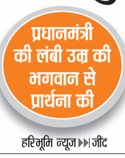
हरिभूमि न्यूज ॥ जीट