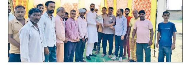
कलायत। श्रमिकों व सरकारी कर्मियों के साथ मौजूद मुख्य अतिथि बृजेंद्र सहारण

प्रधानमंत्री नरेंद्र मोदी के जन्मदिवस के अवसर पर कलायत में श्रम विभाग की तरफ से श्रमिक सम्मान एवं जागरूकता कार्यक्रम का आयोजन किया गया। सेवा पखवाड़े के अंतर्गत आयोजित कार्यक्रम में मुख्य अतिथि के तौर पर भाजपा युवा नेता एवं पूर्व मंत्री प्रधान बृजेंद्र सहारण ने शिरकत की। आयोजन का लक्ष्य श्रमिक वर्ग को सम्मान देना और उन्हें सरकार की जनकल्याणकारी योजनाओं के प्रति जागरूक करना रहा। श्रमिक भाइयों को मिटाई बांटी और उनके साथ पीएम का जन्मदिन हर्षोल्लास